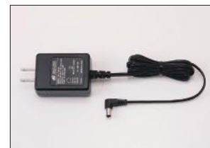
ACアダプター (充電時間約5時間) KSLY-SC