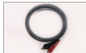
マルチライトミニ用 12Vバッテリーコード ML-12VC