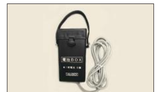
マルチライトミニ用電池ボックス ML-BOX