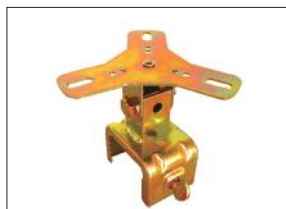
回転灯用クランプ MK-12