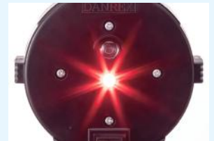
背面 LED 発光時