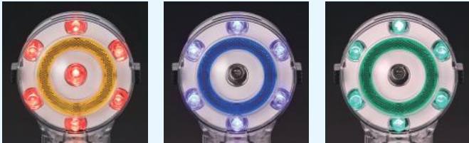
赤 H3-120R 発光時