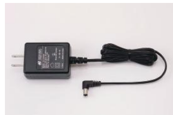
ACアダプター (充電時間約10時間) KSLEY-SC