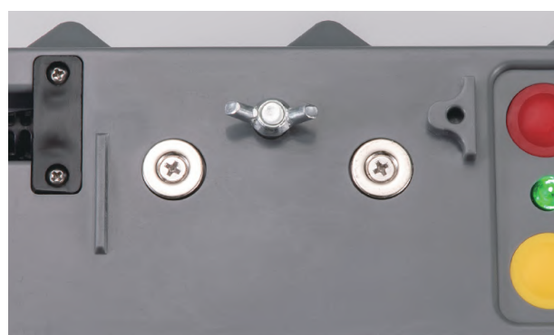
ソーラーユニットに磁石を設置し落下による断線を予防