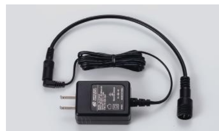
ソーラーストリームアロー用 AC アダプター (充電時間約8時間) SLY-SC-1