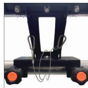
落下防止ワイヤー設置時