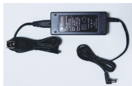
ACアダプター (充電時間約 8 時間) SKCT1-KAC