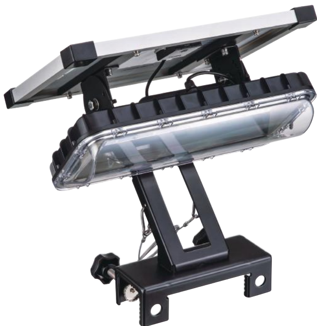
本体(発光部) SAT-350 / 金具部 SAT-YTK