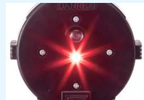
背面 LED 発光時