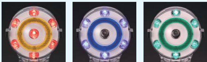
赤 H3-120R 発光時