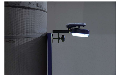
看板が電柱に密着時