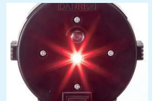
背面 LED 発光時