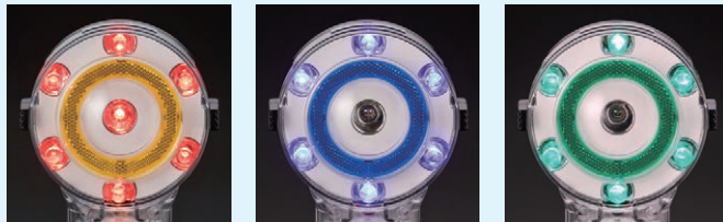
赤 H3-120R 発光時