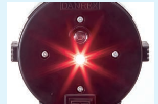
背面 LED 発光時