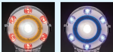
赤 H3-120C 発光時