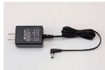
ACアダプター (充電時間約10時間) KSLEY-SC