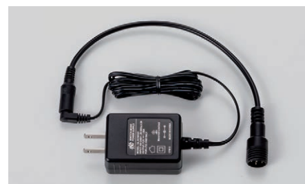
ソーラーストリームアロー用 AC アダプター (充電時間約8時間) SLY-SC-1