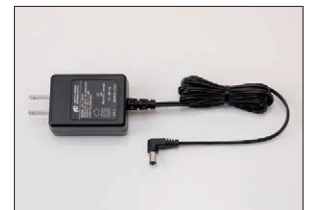
ACアダプター (充電時間約5時間) KSLY-SC