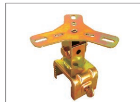
回転灯用クランプ MK-12