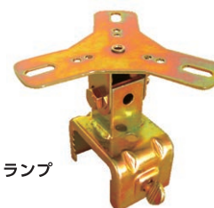
回転灯用クランプ MK-12