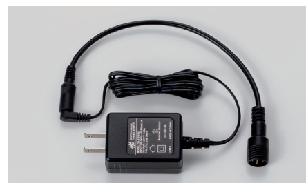
ソーラーストリームアロー用 AC アダプター (充電時間約8時間) SLY-SC-1